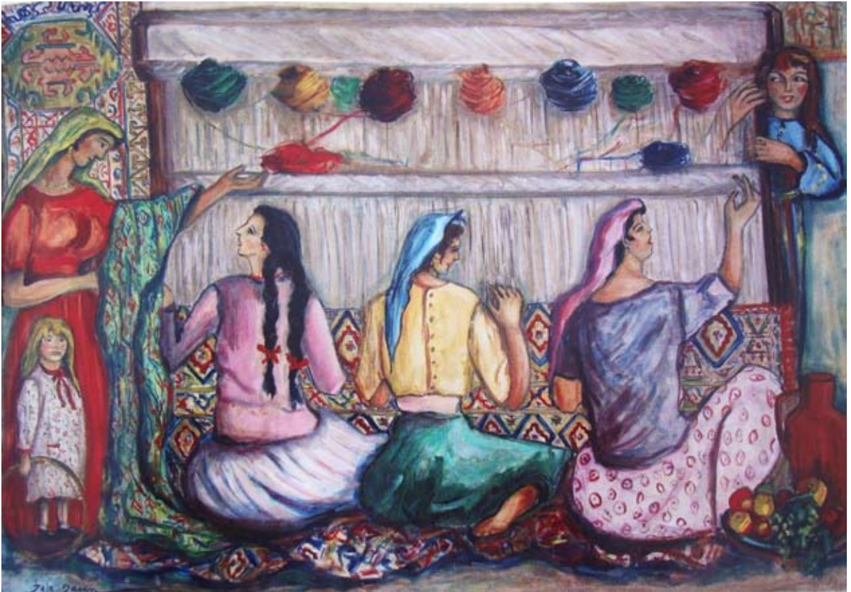
HALI DOKUYAN KADINLAR (1965). Tuval üzeri yağlı boya. 162 x 114 cm. «FEMMES EN TRAIN DE TISSER UN TAPIS» (1965). Huile sur Toile.