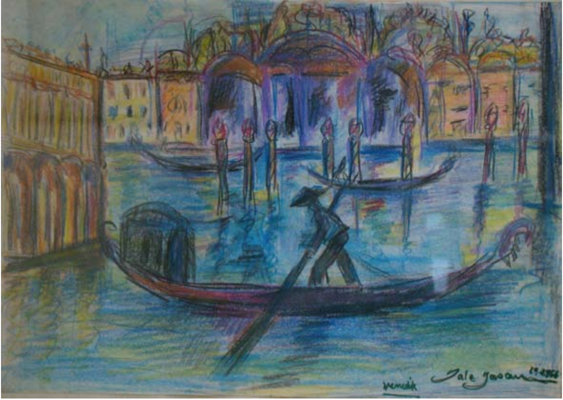
VENEDİK (1966).Pastel. 41 x 29 cm. «VENISE» (1966). Pastel.