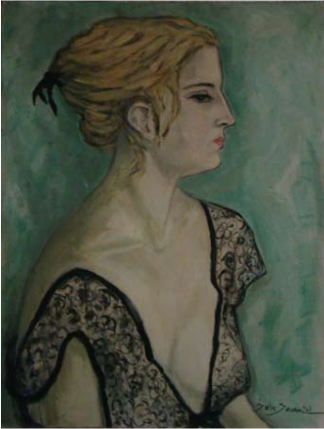
SİYAH DANTELLİ MODEL (1965-66 ). Tuval üzeri yağlı boya. 65 x 50 cm. «LE MODELE A LA DENTELLE NOIRE» (environ 1965). Huile sur Toile.