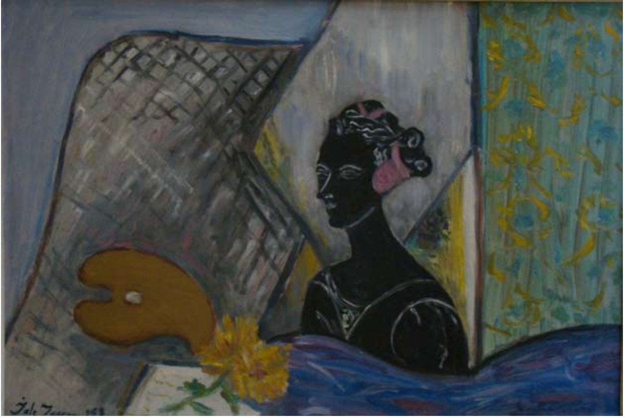
SİYAH BÜSTLÜ, PALETLİ NATÜRMORT (1958). Düralit üzeri yağlı boya. 58 x 56 cm. «NATURE-MORTE AU BUSTE NOIR ET PALETTE» (1958). Huile sur Duralite.