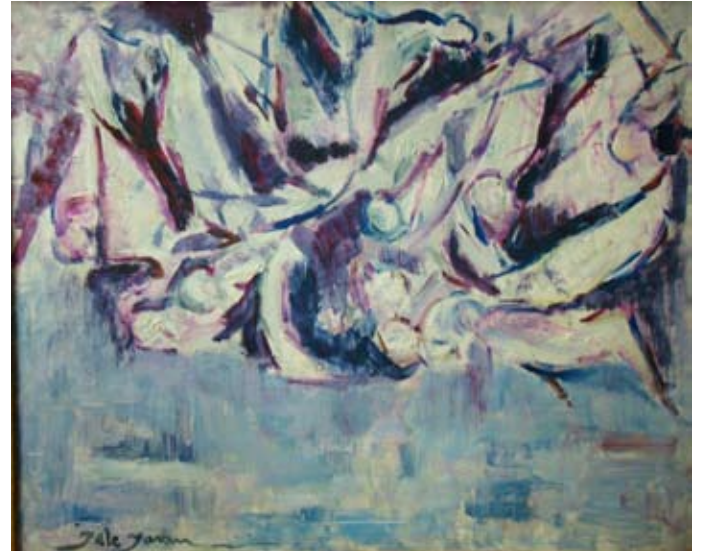
KUŞLAR (II) 1967-68 Düralit üzeri yağlı boya. 61 x 50 cm. «LES OISEAUX (II)» environ 1967-68. Huile sur Toile.