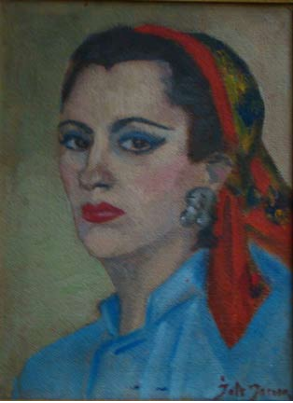
OTOPOSTRE (1957) Düralit üzeri yağlı boya. 35 x 27 cm. «AUTOPORTRAIT». Huile sur Duralite.