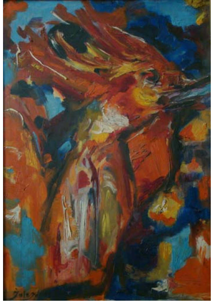
HOROZ (1976). Tuval üzeri yağlı boya. 67 x 47 cm. «LE COQ» (1976). Huile sur Toile (portrait au dos.)