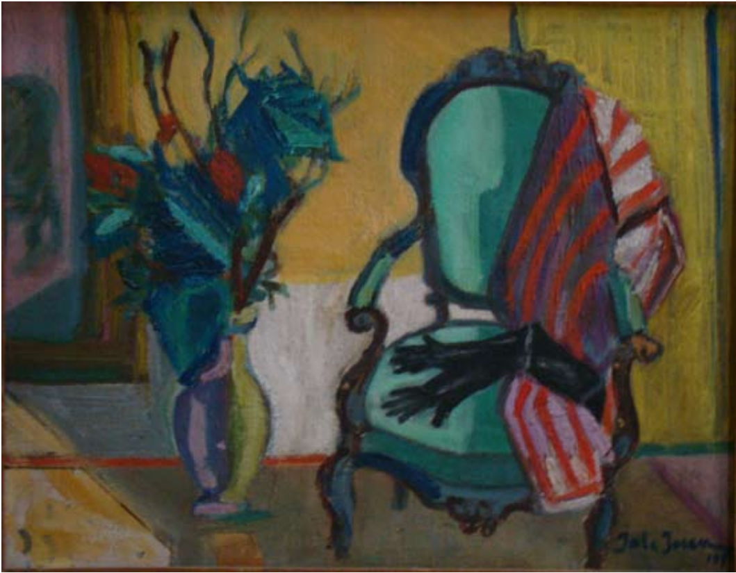
INTERIOR (1958). -Arkası resimli-Düralit üzeri yağlı boya. 40 x 34 cm. «INTERIEUR». Huile sur duralite.