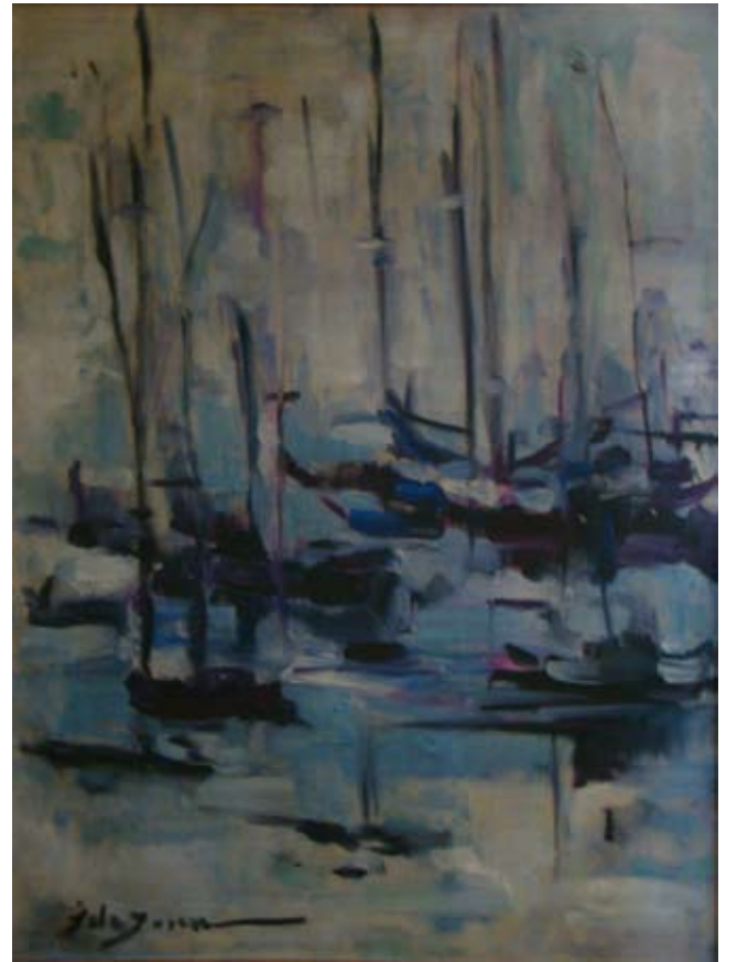
KOTRALAR(1963). Tuval üzeri yağlı Boya. 80 x 60 cm. «VOILIERS» (1963). Huile sur Toile.