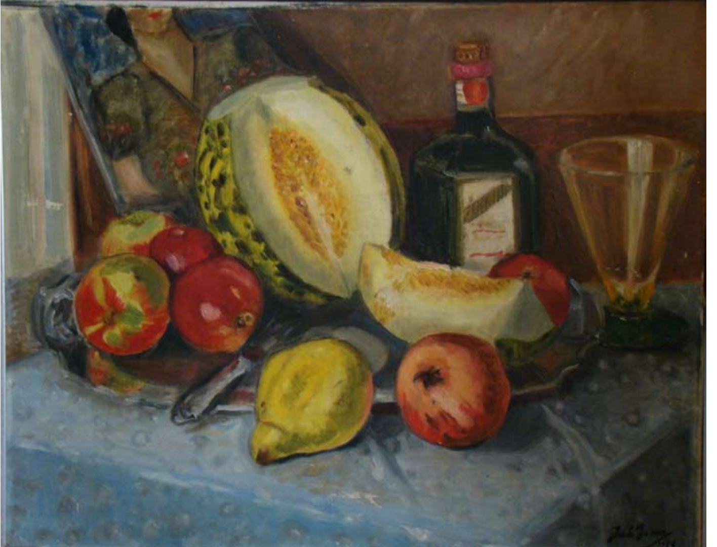
KAVUNLU NATÜRMORT (1956). Tuval üzeri yağlı boya. 61 x 48 cm. «NATURE-MORTE AU MELON» (1956). Huile sur Toile.