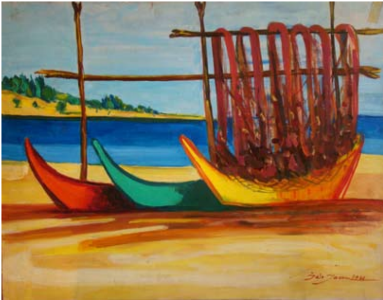
BALIKÇI KAYIKLARI (1960) Düralit üzeri yağlı boya. 64 x 50 cm. «BATEAUX DE PÊCHEURS»(1960) Huile sur Duralite.