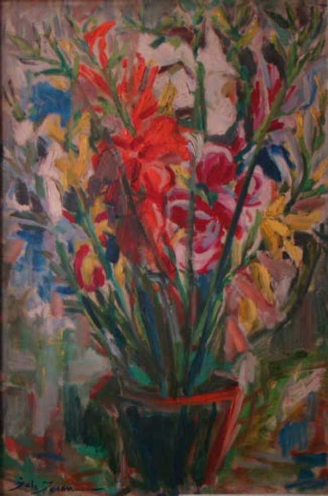
GLAYÖLLER (1968). Düralit üzeri yağlı boya. 74 x 50 cm. (Arkası zenci portresi) «LES GLAÏEULS» (1968). Huile sur Duralite.