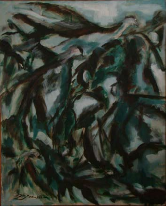
KUŞLAR (I) 1967-68 Tuval üzeri yağlı boya. 91 x 64 cm. «LES OISEAUX (I)» environ 1967-68. Huile sur Toile.