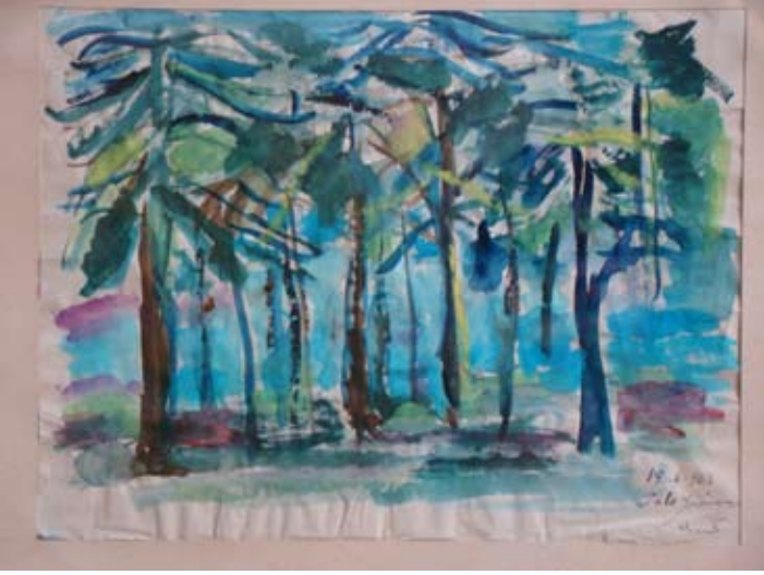
ABANT (1963) Sulu boya. 29 x 22 cm. «ABANT» (1963). Aquarelle.