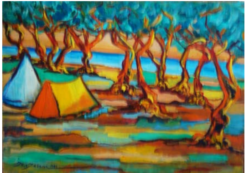
SAHİLDE (1960) Düralit üzeri yağlı boya. 61 x 45 cm. «LA CÔTE» (1960). Huile sur Duralite.