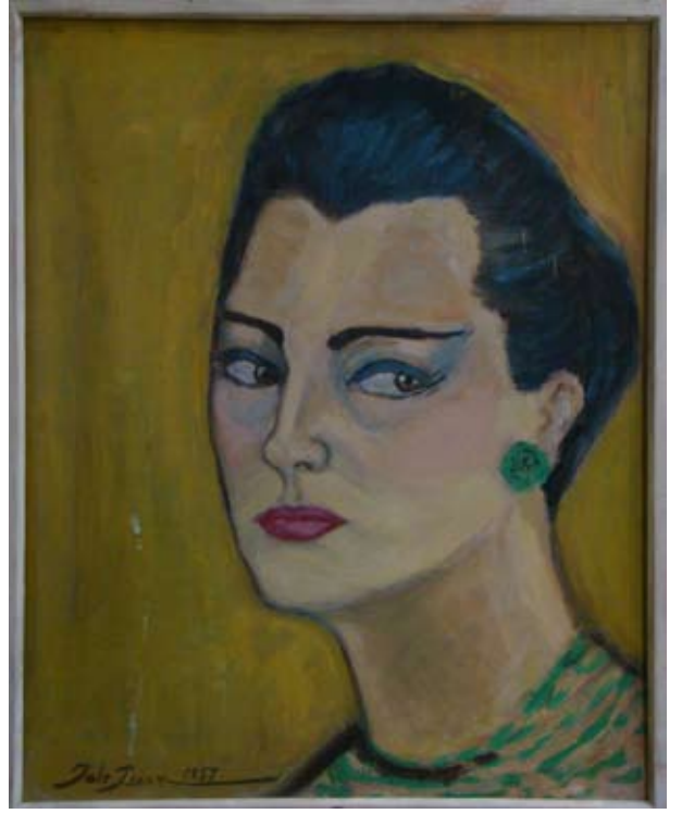
OTOPOSTRE (1959). (Çift taraflı). Düralit üzeri yağlı boya. 45 x 36 cm. «AUTOPORTRAIT». Huile sur Duralite.