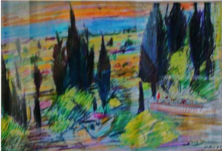
PIERRE LOTI'den HALIÇ. «GOLDEN HORN» -ALTIN BOYNUZ- (1966). Pastel. 40 x 29 cm «LA CORNE D'OR depuis le café PIERRE LOTI» (1966). Pastel.