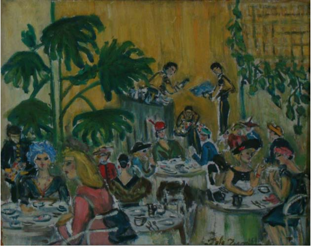
HILTON'DA ÇAY SAATİ (II) (1959-60).Tuval üzeri yağlı boya. 45 x 35 cm. «L'HEURE DU THE A L'HÔTEL HILTON D'ISTANBUL» (1959). Huile sur Toile.