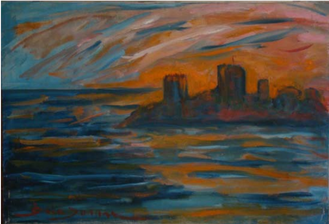
BODRUM'DA KALEYE GÜNEŞ BATARKEN (1980-88). Tuval üzeri yağlı boya. 55 x 38cm. «COUCHER DE SOLEIL SUR LA FORTERESSE DE BODRUM» (1980-88). Huile sur Toile.