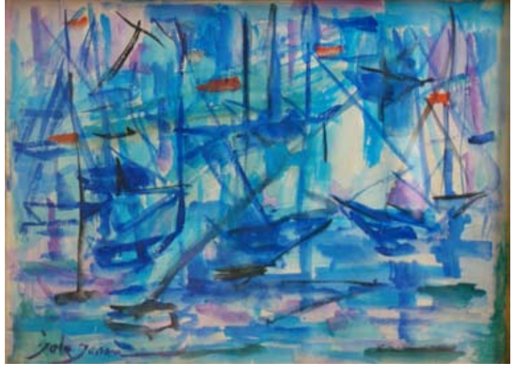
YELKEN YARIŞI (1965-68) Sulu boya. 33 x 24 «LA COURSE DES VOILIERS» Aquarelle.