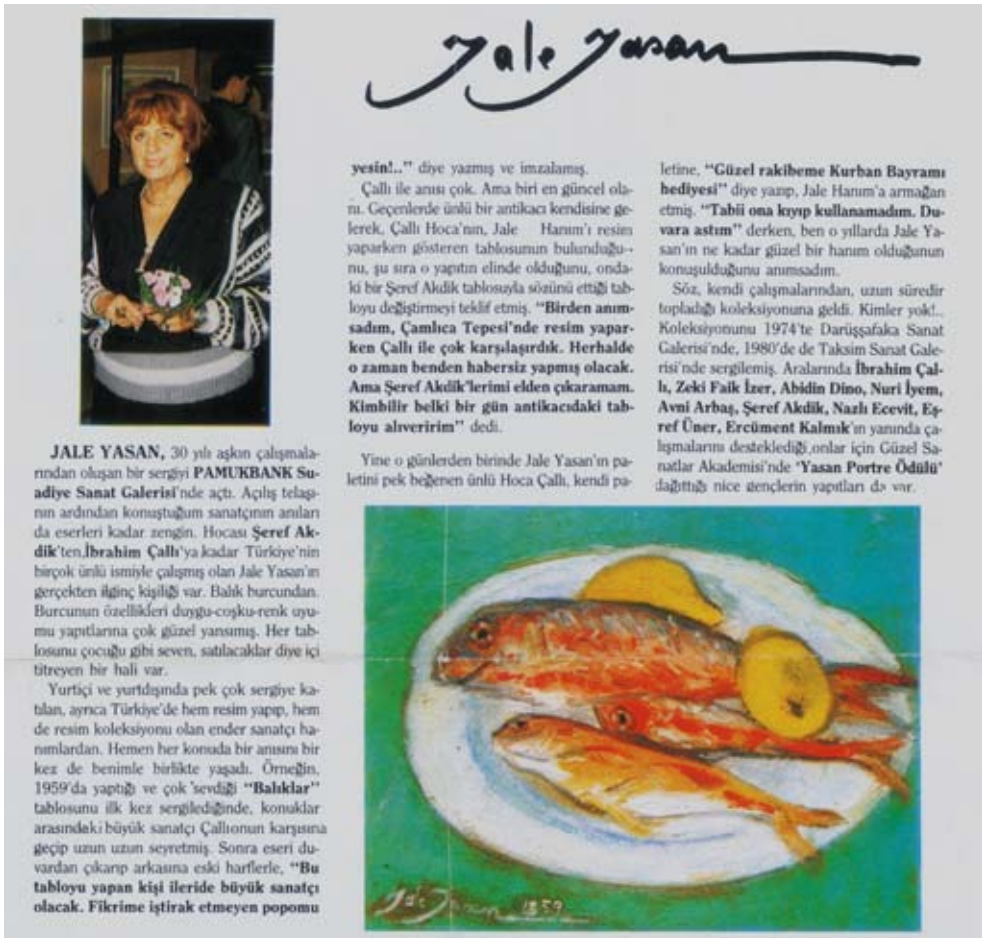
1988-Suadiye-Pamukbank sergisi ve anıları hakkında, Topaz dergisinde çıkan yazı. Publication à propos de l'exposition de J.Yasan à la Galerie Pamukbank à Suadiye (İstanbul).