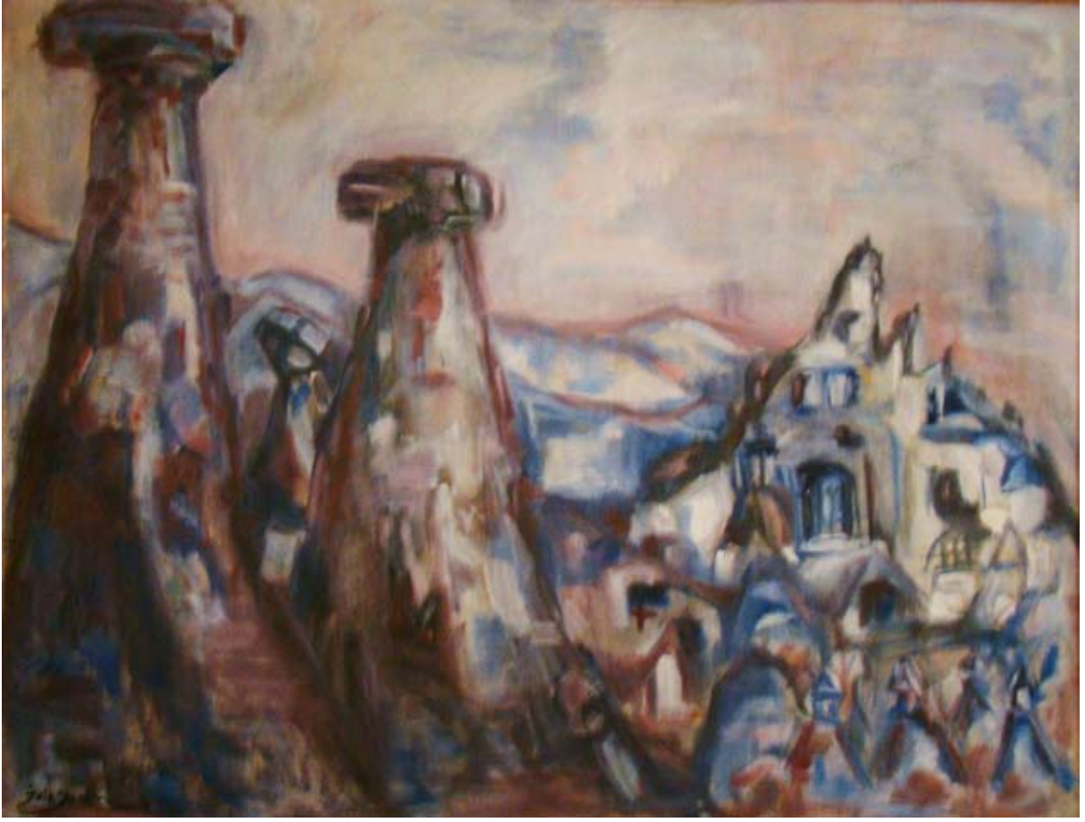
GÖREME (1965-68 ). Tuval üzeri yağlı boya. 116 x 89 cm. «GÖREME» (1965-68). Huile sur Toile.