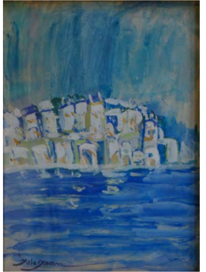
BODRUM EVLERİ (1975-80). Guaş. 35 x 34 cm. «MAISONS A BODRUM» (1975-80). Gouache.