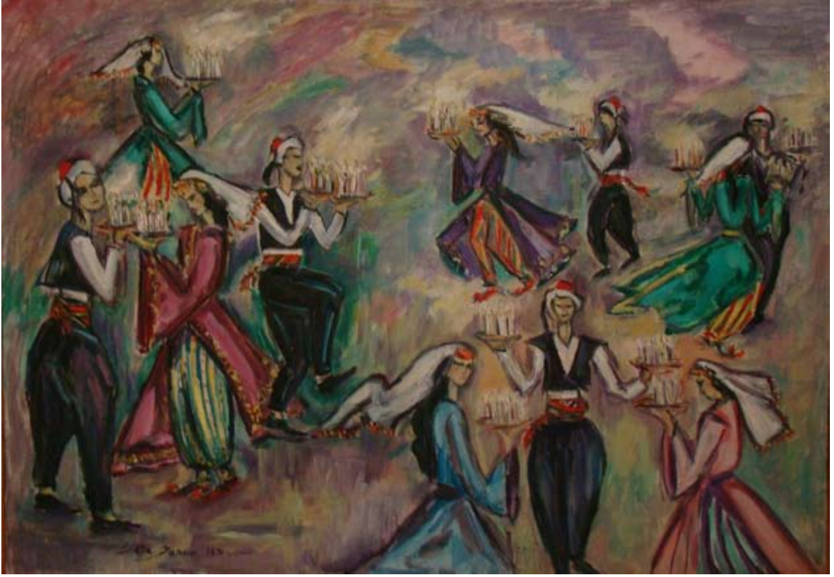
ÇAYDA ÇIRA (1964). Tuval üzeri yağlı boya. 92 x 65 cm. «DANSE FOLKLORIQUE AUX BOUGIES» (1964). Huile sur Toile.