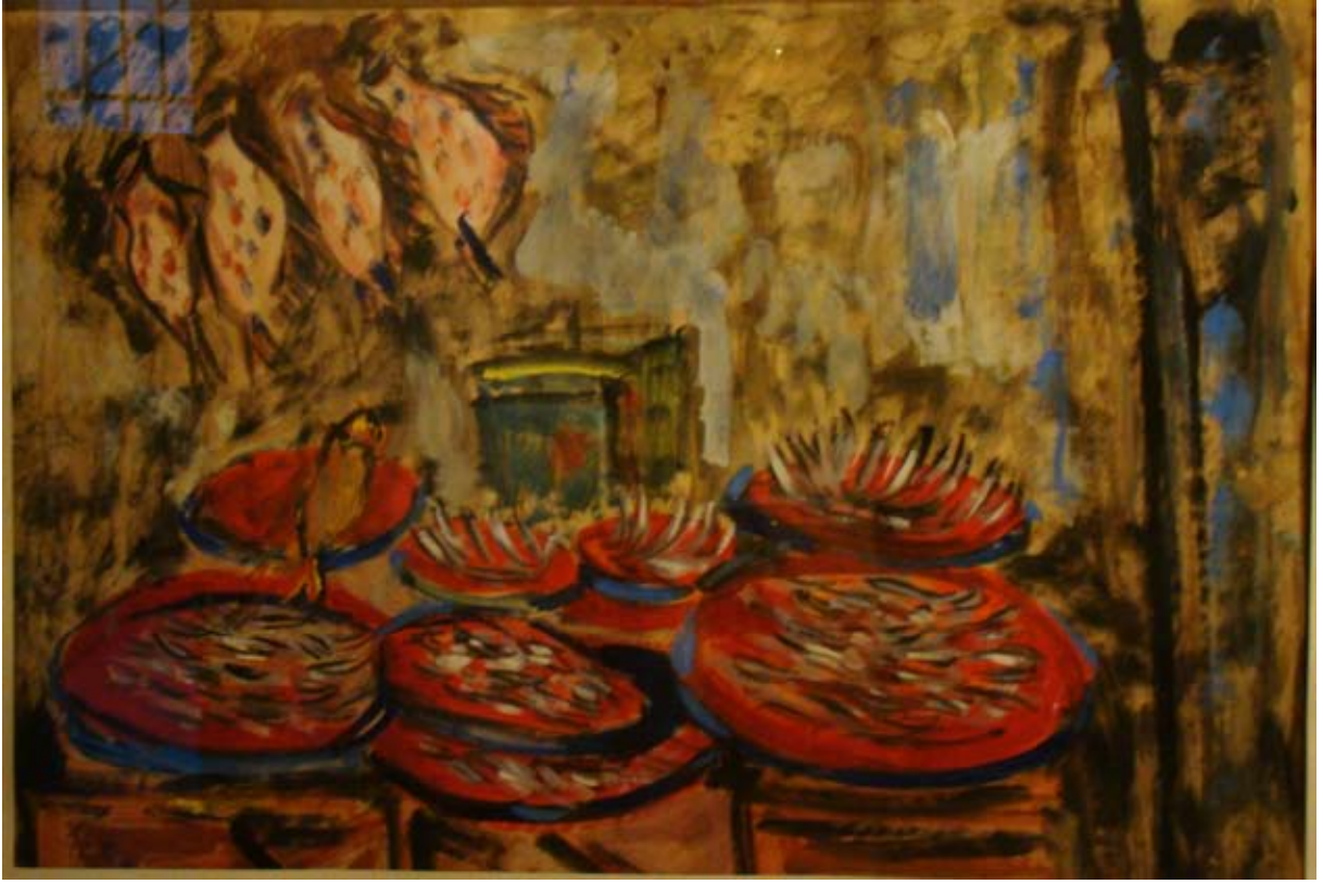
BALIK PAZARI (1966). Kâğıt üzeri yağlı boya. 69 x 48 cm. «LES POISSONS AU MARCHÉ» (1966). Huile sur Toile.