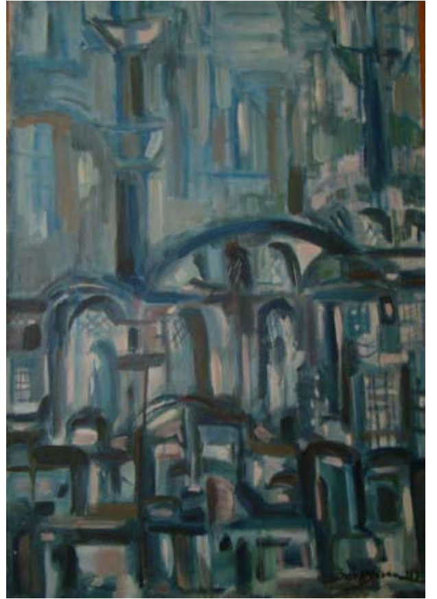
BEBEK CAMİİ (1965-68).Tuval üzeri yağlı boya. 95 x 64 cm. «LA MOSQUEE DE BEBEK» (environ 1965-68).