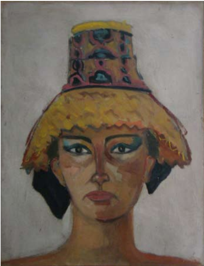
ŞAPKALI PORTRE (1960-63). Düralit üzeri yağlı boya. 40 x 51 cm. (Arkası desenli). «PORTRAIT AU CHAPEAU» (1960-63). Huile sur Duralite. (Dessin au dos).