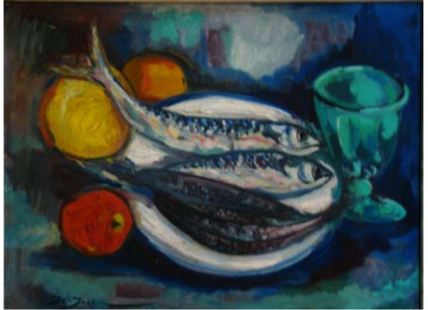
USKUMRULAR (1960-61). Düralit üzeri yağlı boya. 55 x 42 cm. «NATURE-MORTE AUX MAQUEREAUX» (1960-61). Huile sur Duralite.