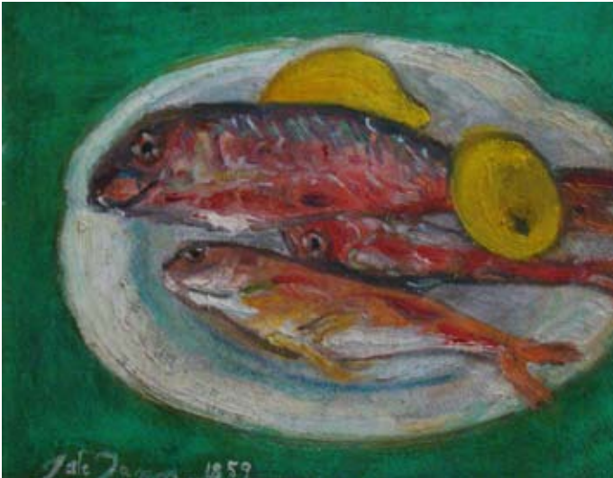
BARBUNYALAR (1959). Düralit üzeri yağlı boya. 35 x 28 cm. (Ön kısım). «LES ROUGETS» (1959). Huile sur Toile. (côté face).