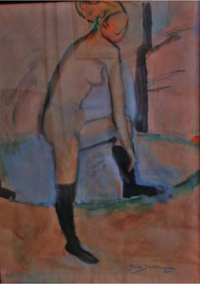
SİYAH ÇORAPLI NÜ (1965-68) Sulu boya. 68x 50 cm. «NU AUX BAS NOIRS» (1965-68). Aquarelle.